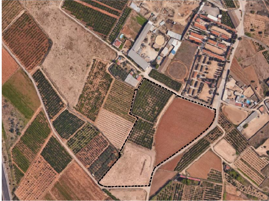
Àmbit de la proposta per a l'ampliació del cementeri municipal.